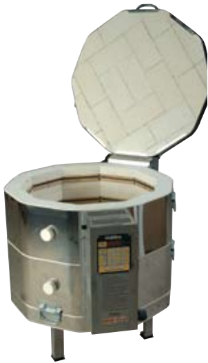
e23S (125 Liter)