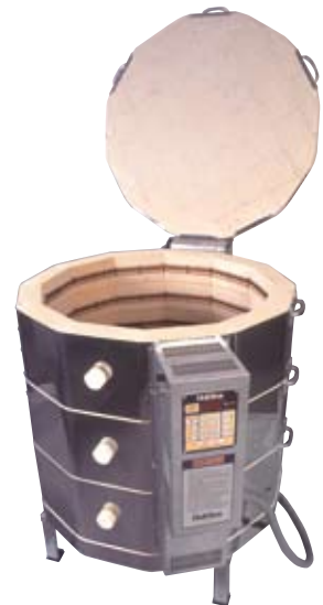
e28T (290 Liter)