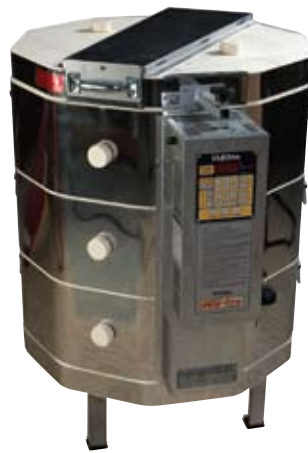
e23T (190 Liter)